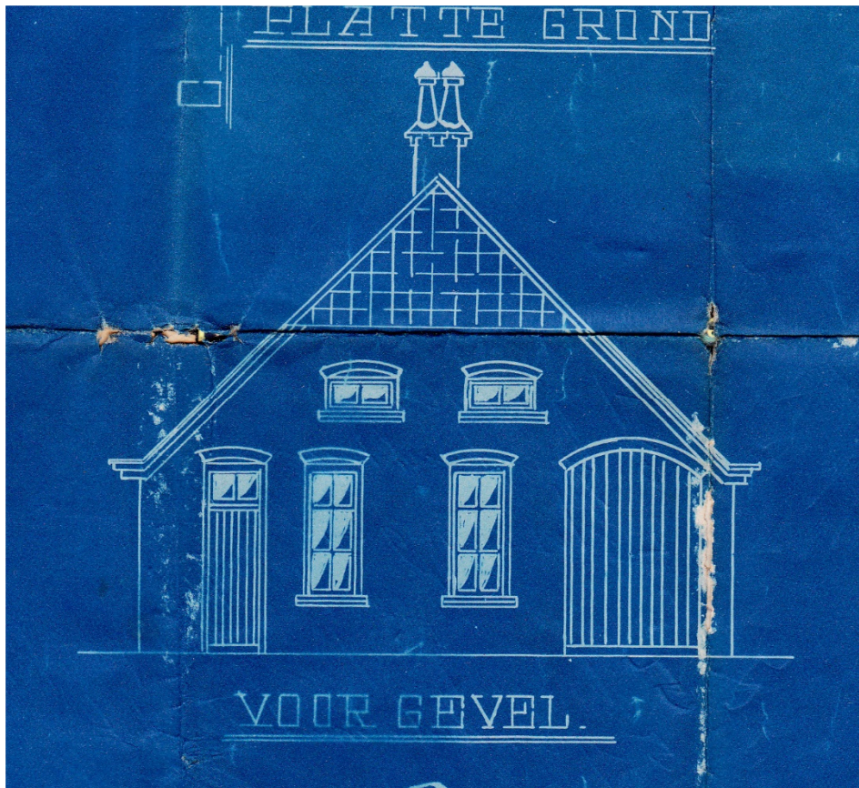
Figuur3: Het leschhuis van de kalkkoven aan de Noordzijde van de Nonkeswijk, als echte blauwdruk, uit 1922. De ouders van de briefschrijver woonden hier.

De Vriezenveensche Wijk wordt ook niet druk meer bevaren. Turf, strooiselbalen gaat meest per auto, net dat er wat balen per groote schepen naar Rotterdam moeten of een vlet voor het station Vroomshoop en dan een enkele scheepje met fabrieksaardappels naar Coevorden en pootgoed voor de waggon Vroomshoop.